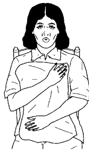
Toussez et respirez profondément