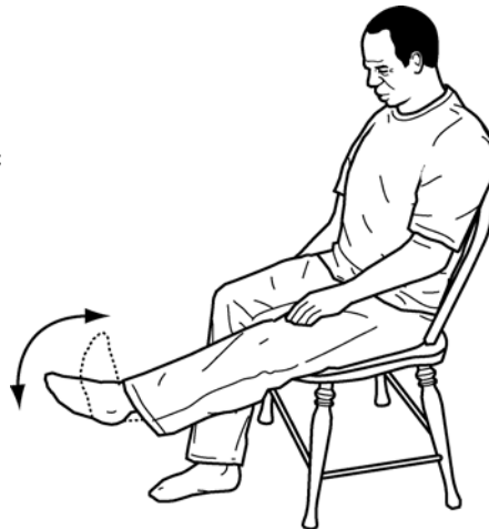
Flexions de la cheville